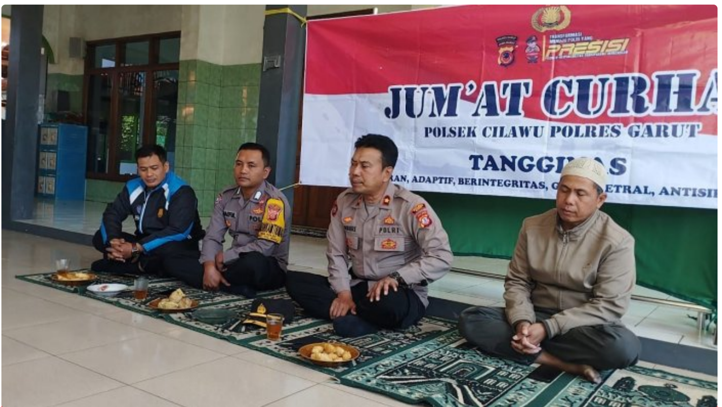
Kapolsek Cilawu mendengarkan curhatan warga